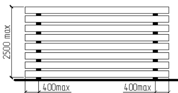
Складирование железобетонных плит